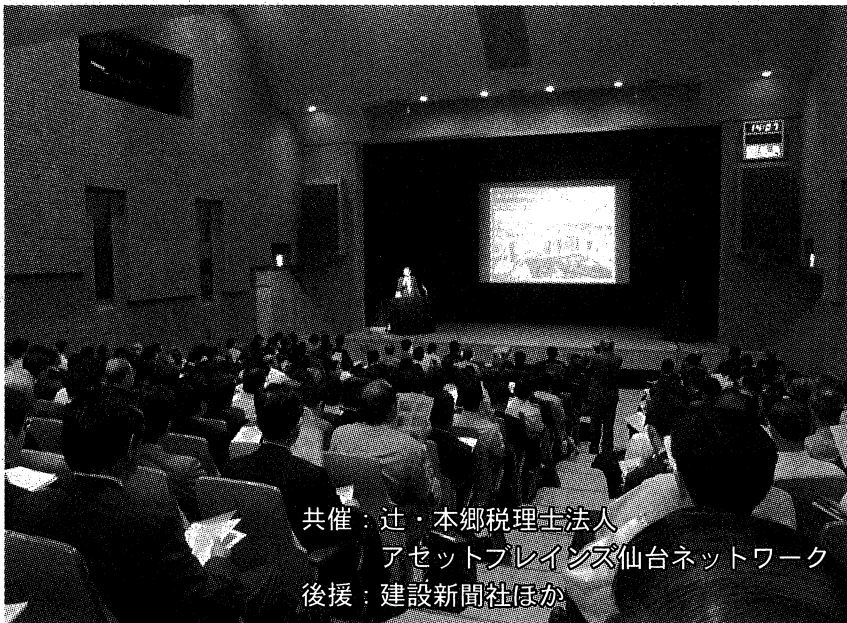
共催：辻・本郷税理士法人 アセットブレインズ仙台ネットワーク 後援：建設新聞社ほか

建設新聞社などが後援したこのセミナーには、活発化している不動産証券化や都心部などを中心とした“ミニバブル”ともいえる不動産高騰の現状と、今後の動向を見極めたいとする多くの建設産業関係者、不動産業者などが詰めかけ、関心の高さをうかがわせた。